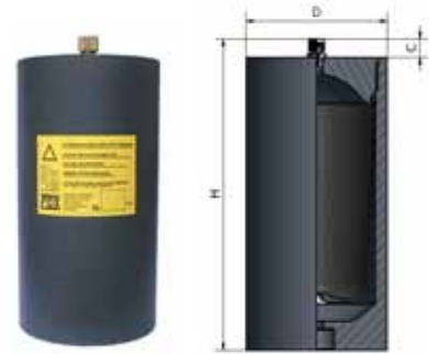
Drawing №2 / чертеж №2