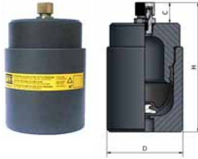
Drawing №1 / чертеж №1